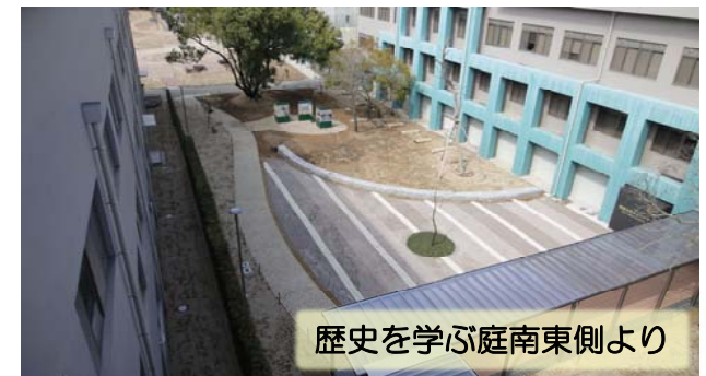
歴史を学ぶ庭南東側より