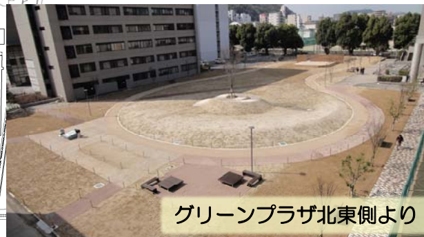
グリーンプラザ北東側より