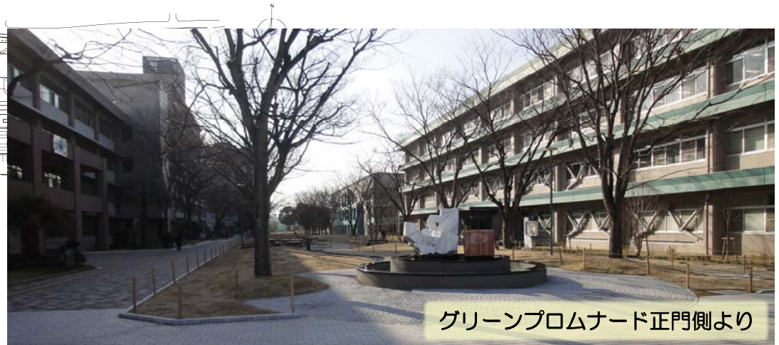
グリーンプロムナード正門側より