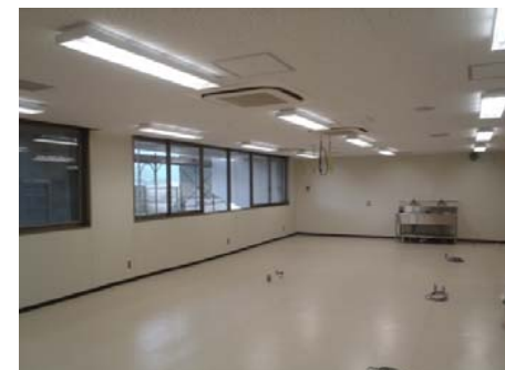
【改修後(実験スペース)】