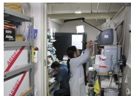
【改修前(実験スペース)】