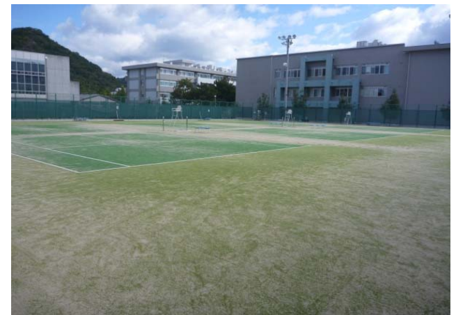
【全天候テニスコート整備完了】