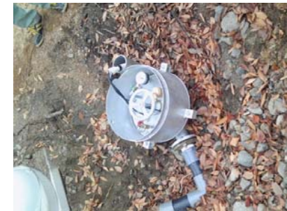
【井戸ピットレスユニット】