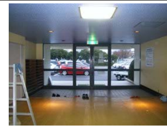
【改修前(玄関ホール)】