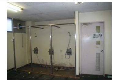
【改修前(男子更衣室)】