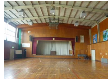
【改修前(体育館内観)】