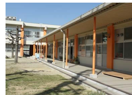
【改修後(テラス外観)】