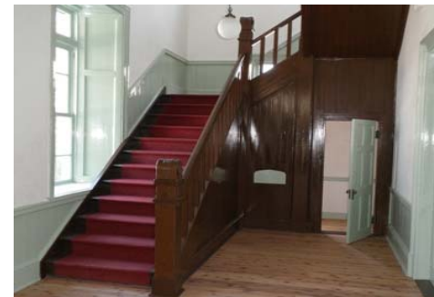
【改修後(玄関ホール)】