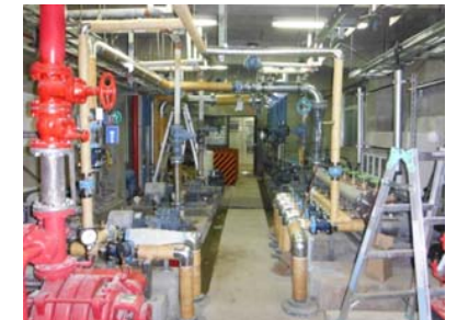
【ポンプ室据付状況】