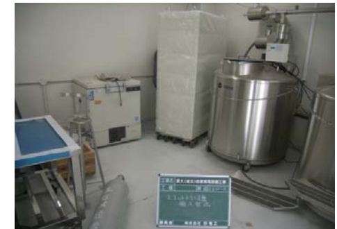
【生物環境試料バンク】