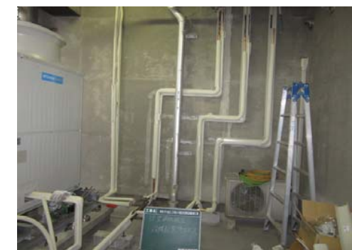
【冷媒配管施工状況】