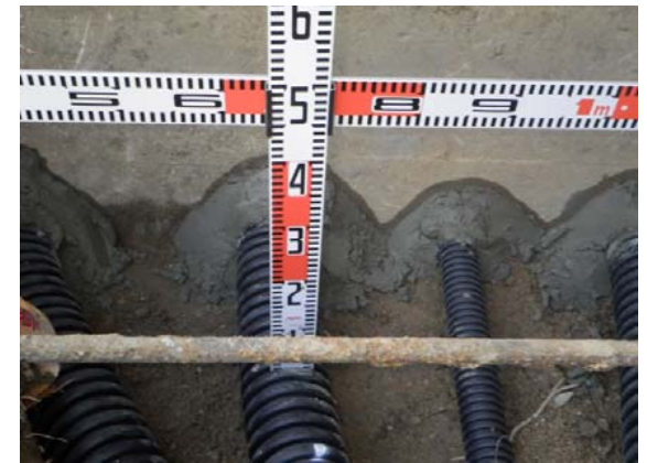
【法文学部2号館・倉庫棟屋外埋設配管状況】