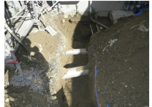
【法文学部2号館・倉庫棟屋外掘削状況】