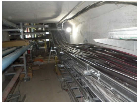
【法文学部本館共同溝ケーブル延線状況】