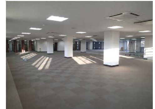
【2階内部(ホール・開架書庫・閲覧室)】