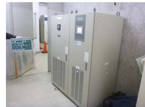
【入出力盤、UPS装置盤更新完了】