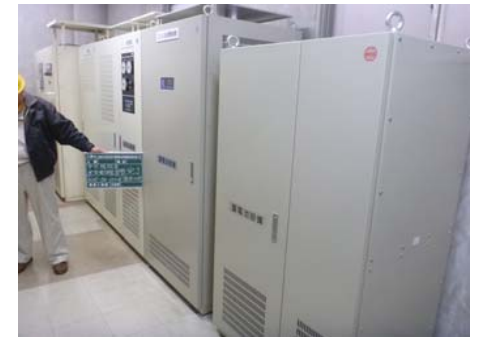
【直流電源装置盤更新完了】