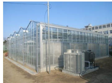
【太陽光利用型植物工場C】