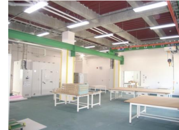
【作業・機械実験室】