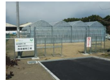
【太陽光利用型植物工場D】