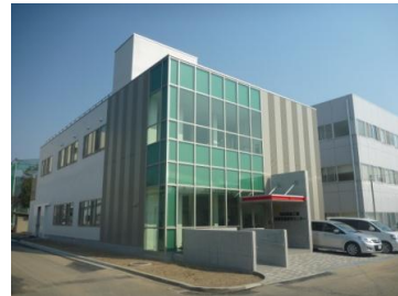
【知的植物工場基盤技術研究センター】