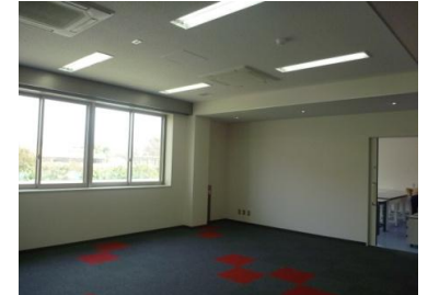
【ミーティング・展示室】