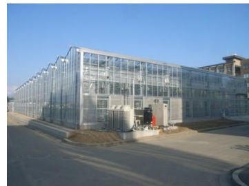
【太陽光利用型植物工場B】