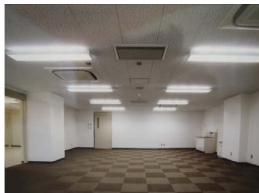
【改修後研究スペース】