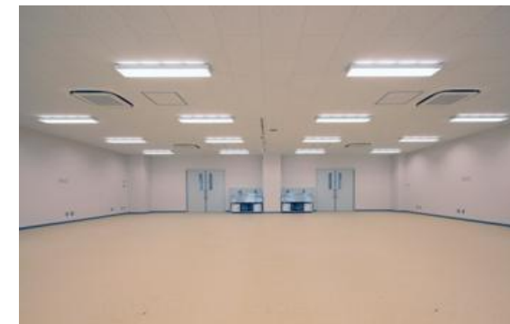
【トレーニング・ステーション】