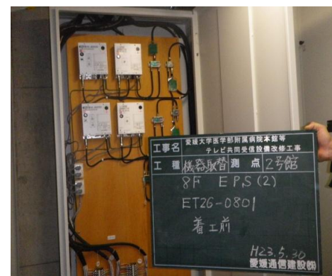
【アナログ用ブースター】