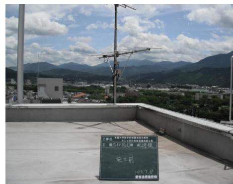
【アナログ用アンテナ】