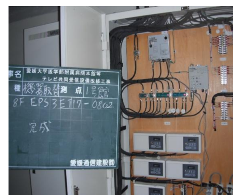
【地デジ用ブースター】