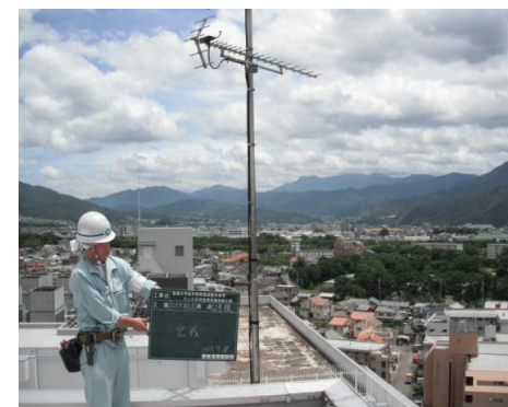
【地デジ用アンテナ】