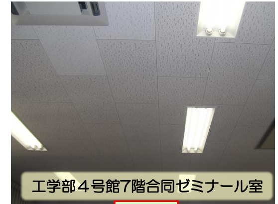
工学部4号館7階合同ゼミナール室