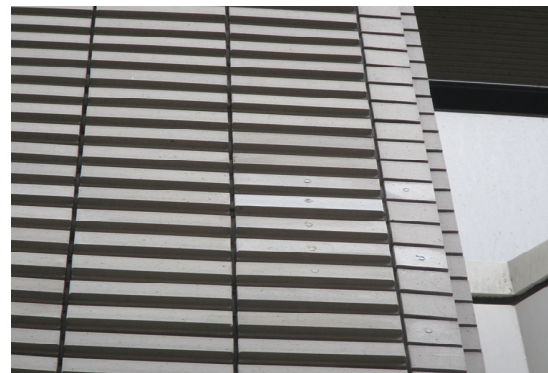
タイル浮き部補修