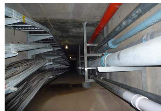
消火管更新 (共同溝内)