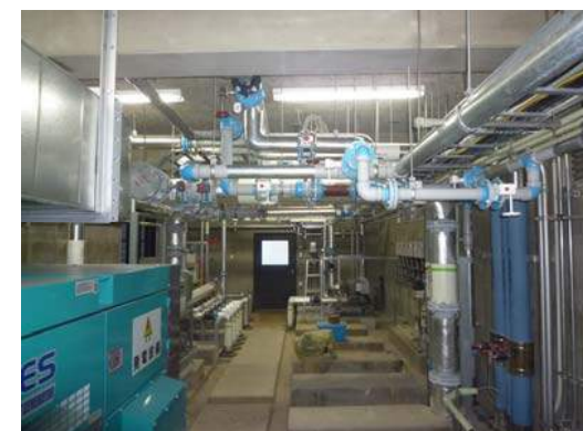
給水管更新 (ポンプ室)