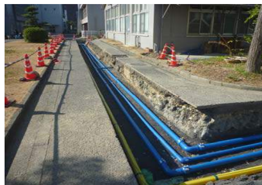
給水管・ガス管更新 (地中埋設)