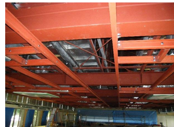
天井耐震補強鉄骨