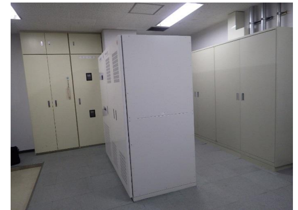
直流電源設備更新後