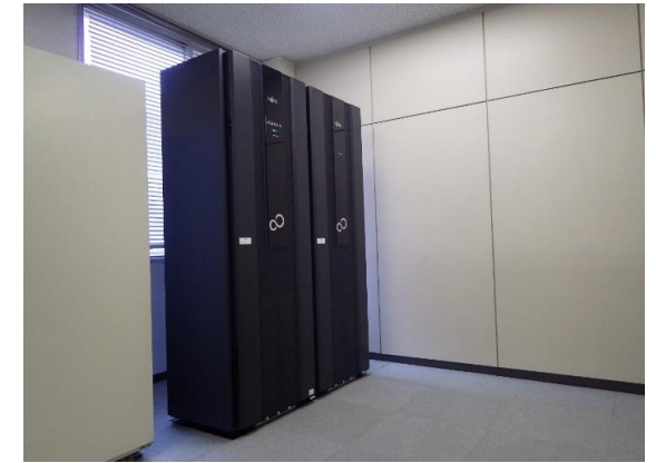
電話交換機更新後