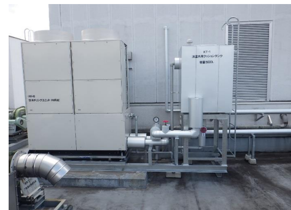
R I 系統室外機改修後