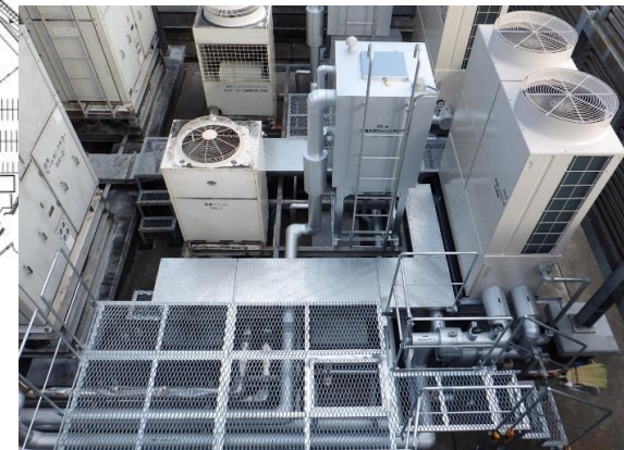
I C U 系統室外機改修後