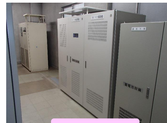
直流電源設備更新後