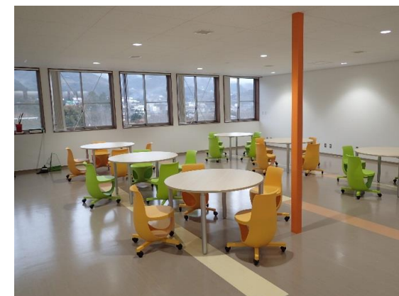
内観(2階ミーティングコーナー)