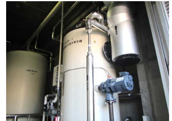
温水発生機改修後