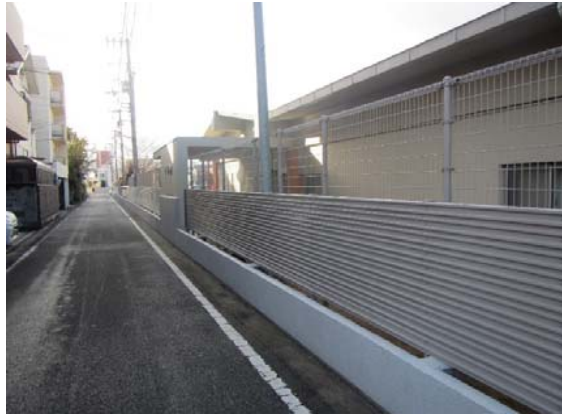
附属特別支援学校東側囲障改修後