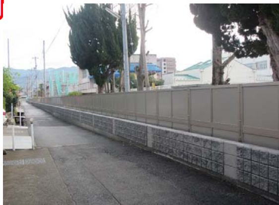
附属特別支援学校東側囲障改修