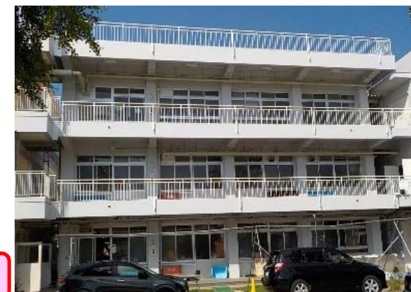
附属中学校本館外壁改修後