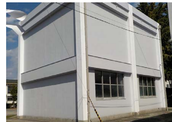
音楽教室外壁改修後