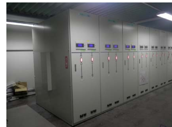
高圧配電盤更新 完成