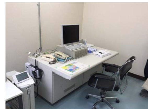
中央監視装置新設 完成