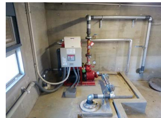
消火ポンプ改修 完成