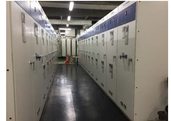
中央機械室: 高圧配電盤更新 完成