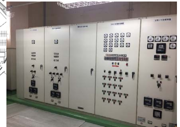
発電機室: 高圧配電盤更新 完成