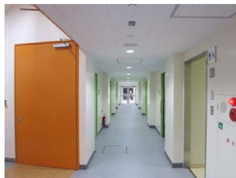
【農学部3号館1階廊下】