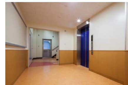
【教育学部3号館1階ホール】