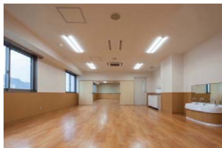
【教育学部3号館6階保育観察室】