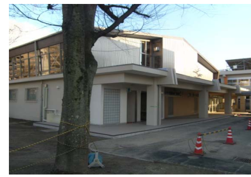
【中学校体育館外観西面】