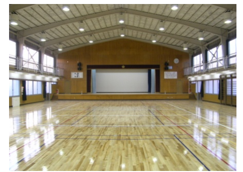
【小学校体育館内部西面】