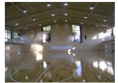
【中学校体育館内部東面】