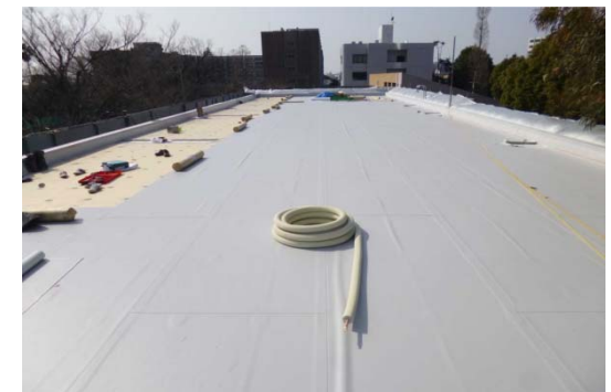
【屋上防水施工状況】