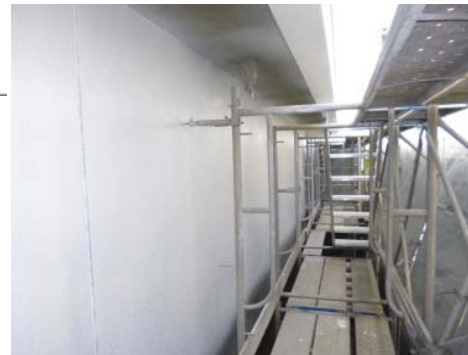
【外壁(東面)施工状況】