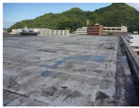
【改修前(老朽化した防水層)】