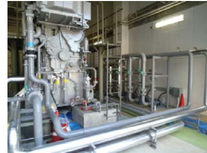
【非常用発電機】 1,500kVA更新