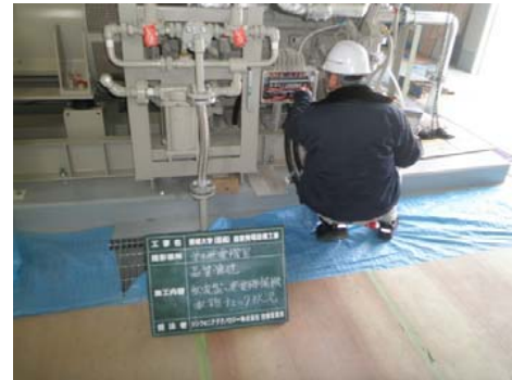
【発電機チェック状況】