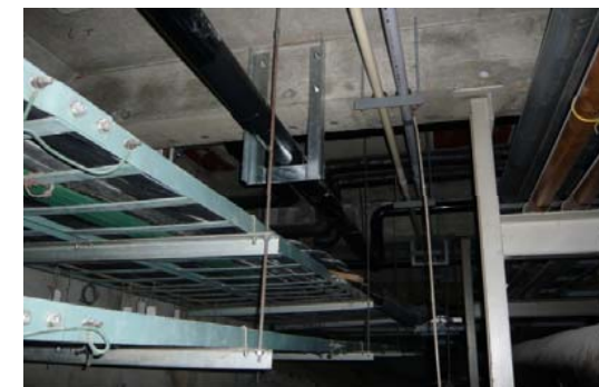
【医療ガス配管更新】