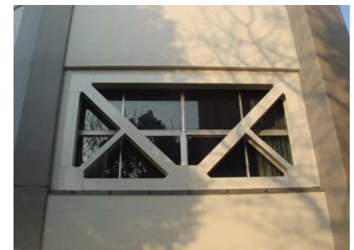
【南面ブレース設置】