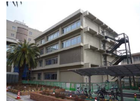
【理学部2号館外観北西面】