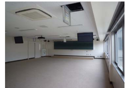
【法文学部2号館3階講義室】