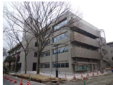
【法文学部2号館外観北西面】