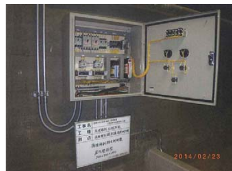
【病理解剖排水制御盤】