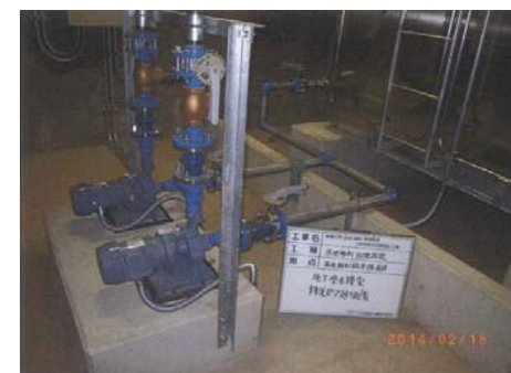
【地下受水槽室移送ポンプ廻り配管】