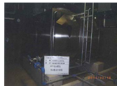
【地下受水槽室受水槽廻り配管】