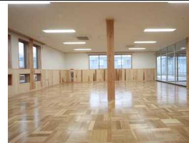
【事務室・展示スペース】