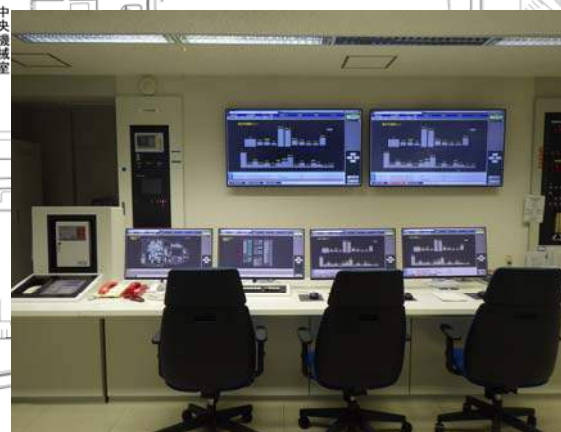
火災報知設備 受信機更新