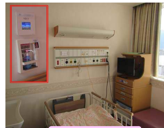
ナースコール設備更新