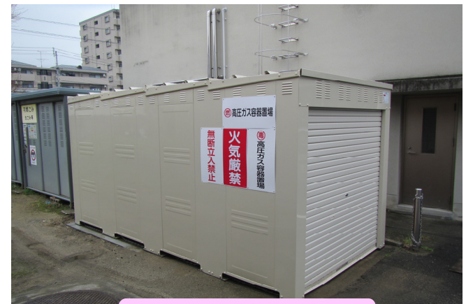
文京2番地区 ボンベ庫