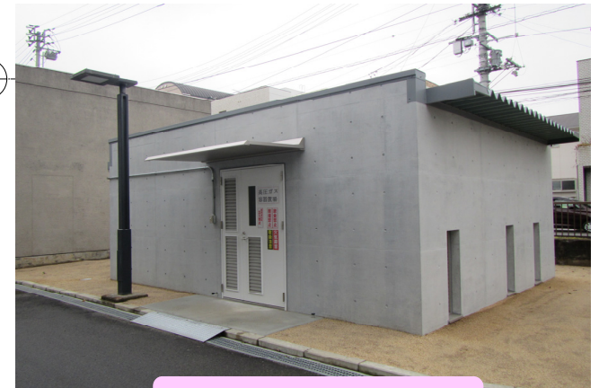
文京3番地区 ボンベ庫