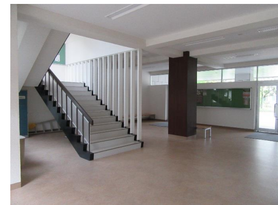
玄関ホール改修後