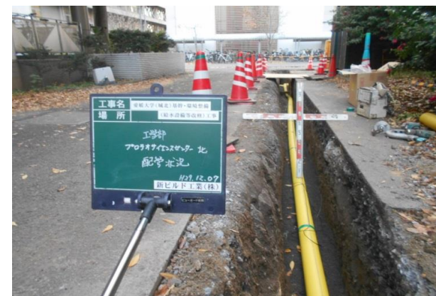
地中埋設配管更新状況