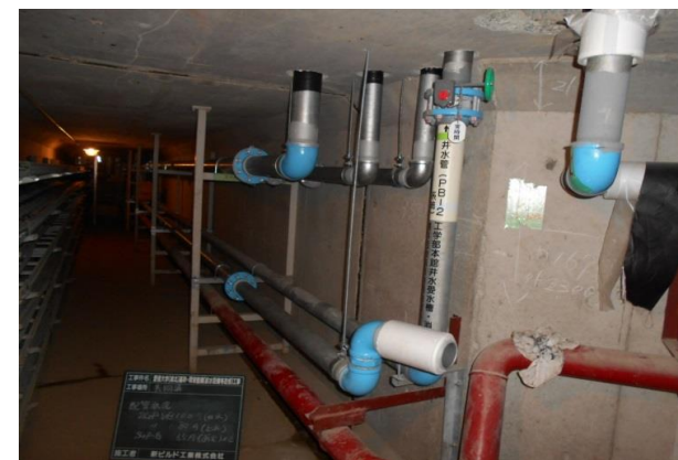
共同溝内配管更新状況