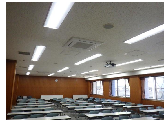
講義室照明・空調改修後