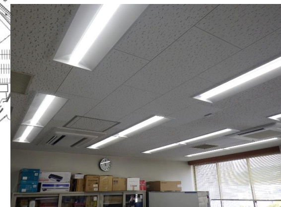
教員研究室照明改修後