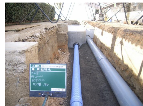
地中埋設配管更新状況