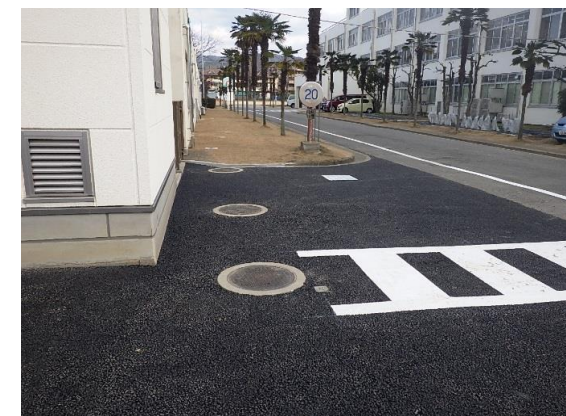
構内道路舗装改修