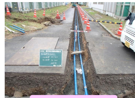
地中埋設配管更新状況